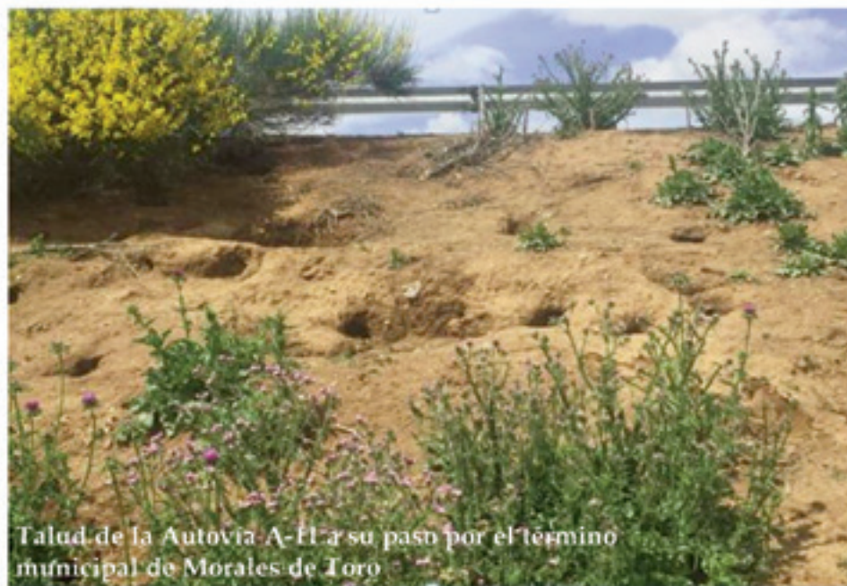
Talud de la Autovía A-11 a su paso por el término municipal de Morales de Toro

•COAG exige a los titulares de las vías limpieza, medidas de control de la especie e indemnizaciones compensatorias