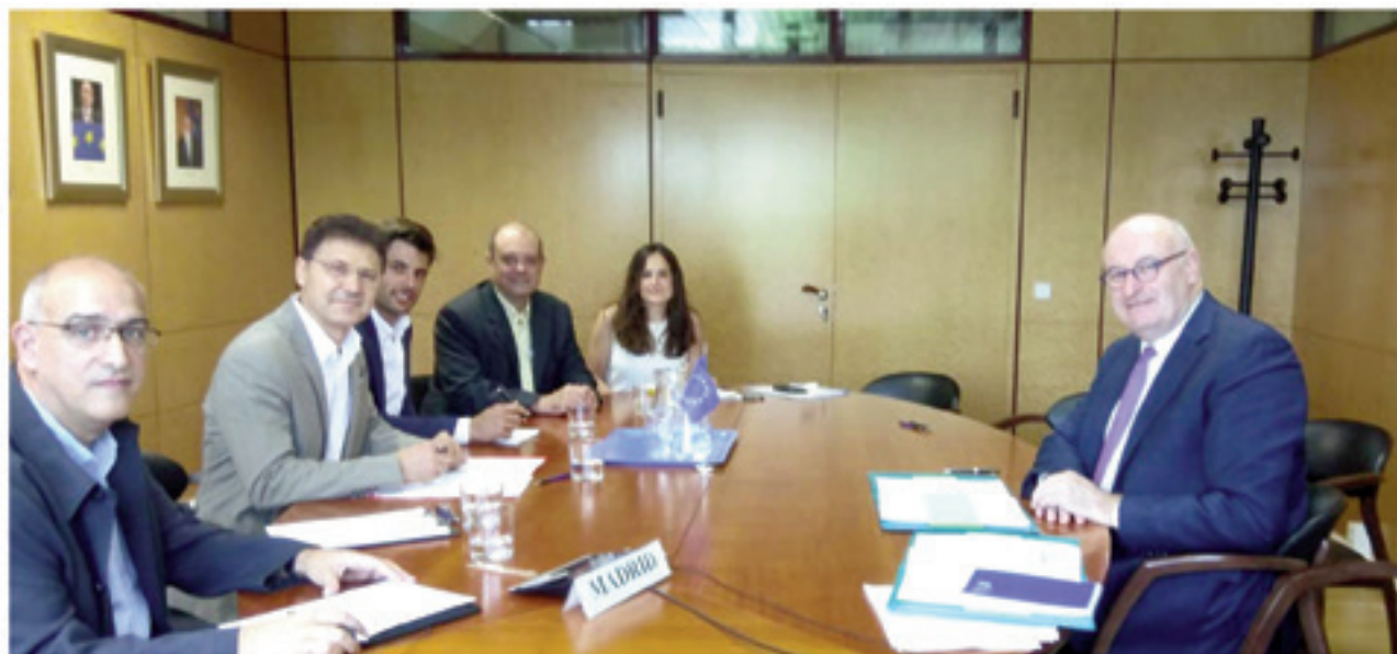
CUMBRE/REUNIÓN BILATERAL DE LOS RESPONSABLES DE NUESTRA ORGANIZACIÓN CON EL COMISARIO DE AGRICULTURA