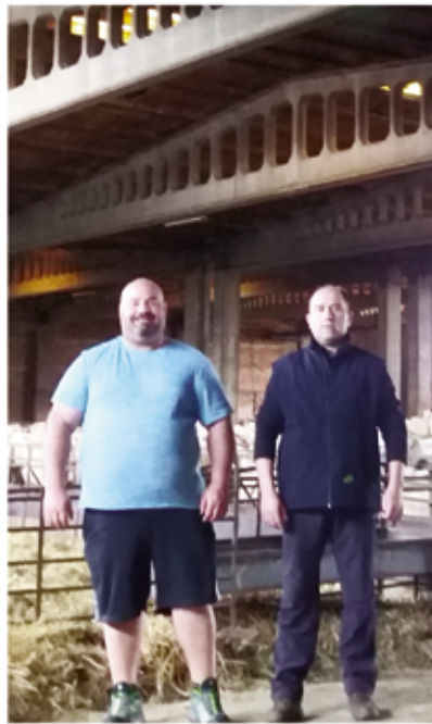
trabajo bien realizado”.