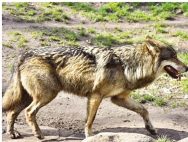
EL TSJ DE CASTILLA Y LEÓN PARALIZA LA CAZA DEL LOBO AL NORTE DEL DUERO

UPA-COAG consideran dramática la situación que sufren a día de hoy los ganaderos de extensivo de la región. Los datos cada vez son más concluyentes sobre la extrema gravedad del asunto, y es que los ataques de lobos en nuestra comunidad siguen incrementándose año tras año, con casos especialmente significativos como Ávila y Segovia donde la presión a los ganaderos es extrema. Nuestra organización considera un desastre para la actividad ganadera extensiva que del año 2001 al 2013 el censo de lobos se incrementara en un 20 % según la propia Junta de Castilla y León, y que de ese año al actual el número de cánidos siga creciendo a un ritmo vertiginoso. La evolución de lobadas en los últimos ejercicios refleja la expansión del cánido en Castilla y León, con 1.463 ataques en el año 2015 frente a 1.979 en el año 2017. En el primer tri-