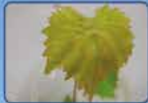
PLANTA EXPUESTAS A VAPOR DE AGUA

EFECTO VAPOR. PLANTAS INOCULADAS CON OÍDIO E INCUBADAS EN CAMPANA DE CRISTAL.