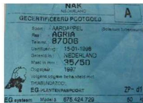
Etiqueta patata certificada origen no nacional