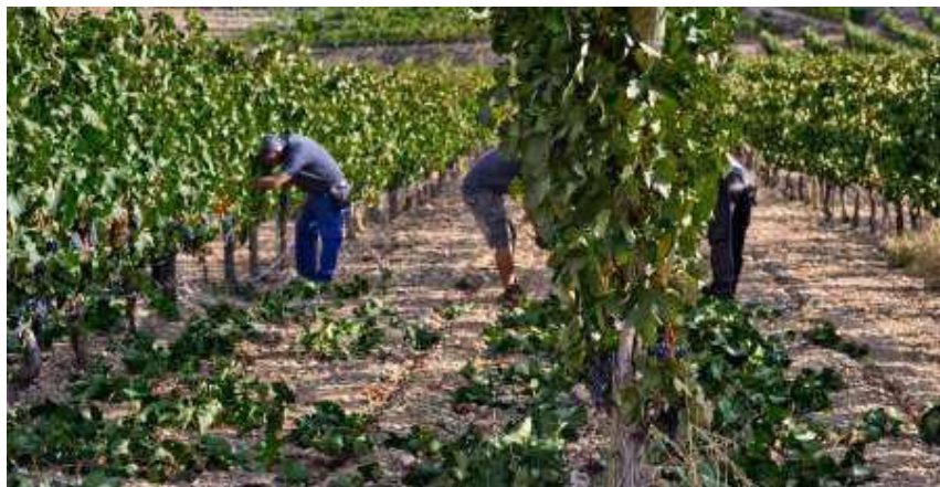
Operaciones de regular vegetación en viñedo

El drenaje del suelo es también importante. Los “gusanos del alambre” suelen vivir en terrenos húmedos, y una labor de saneamiento dificulta su propagación. A veces un encharcamiento del terreno también contribuye a destruir patógenos (como el “gusano de la raíz” de la remolacha azucarera).