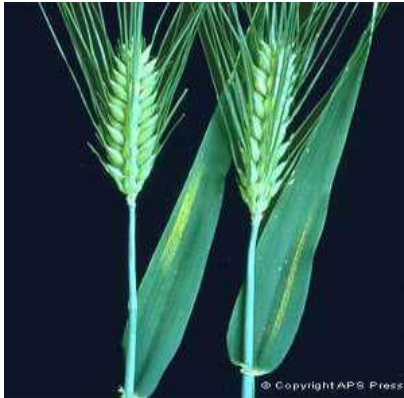
Reducción del crecimiento por hongos (cebada) Puccinia en cebada (roya)