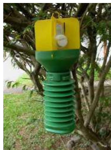
Trampas para capturas de insectos