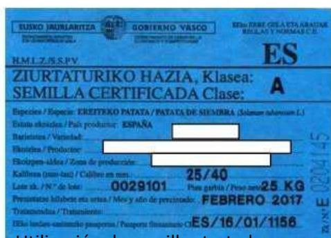
Utilización de semillas tratadas

Se basan en prevenir la entrada de fitopatógenos en determinadas zonas (países, comarcas, etc.) o incluso en las parcelas concretas.