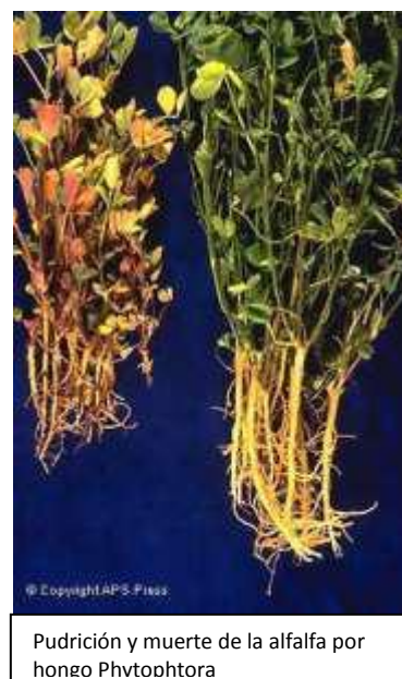
Pudrición y muerte de la alfalfa por hongo Phytophthora

A veces es difícil la identificación por no encontrar esporas o estructuras fructíferas en el tejido enfermo.