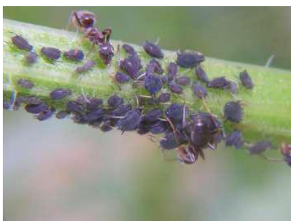
Insectos pulgón negro