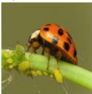
Mariquitas control natural de pulgones

Algunos insectos, llamados insectos útiles, viven a costa de insectos perjudiciales. Este es el caso de la mariquita, que va a buscar su presa (pulgones) y se la come, o de ciertas avispas, que ponen sus huevos en insectos perjudiciales, y la larva que sale se alimenta de su hospedero.