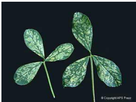
Mosaico por virus en alfalfa