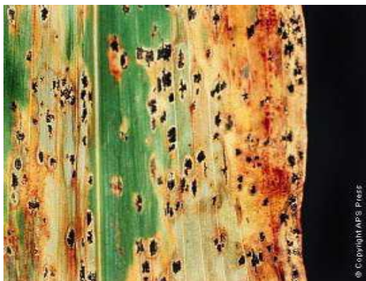
Antracnosis por hongo Colletotrichum en sorgo

Ej.: Hongo Colletotrichum lindemuthianum , que ataca a Phaseolus spp., es la antracnosis del frijol.