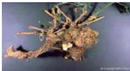
Agalla (tumor) en alfalfa por bacteria Mildum en hojas sobre patatas Agrobacterium